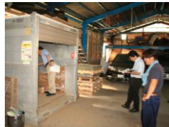
農場現場での評価と指導